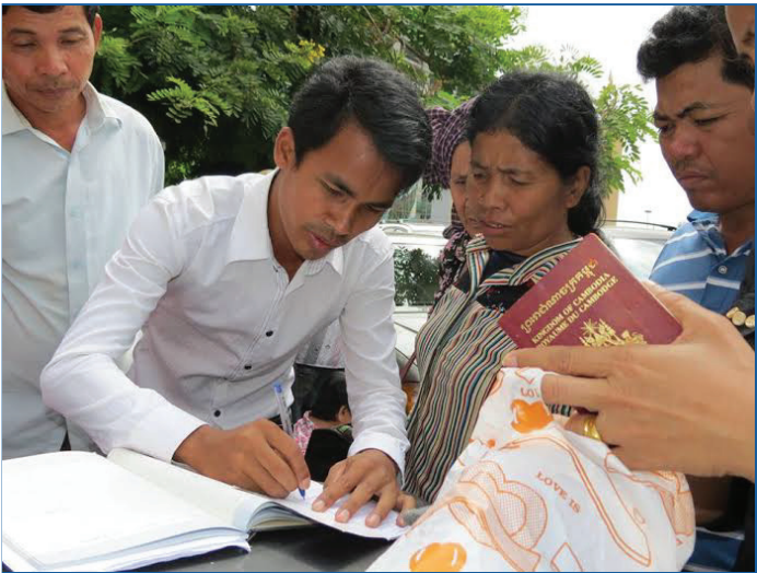
គម្រោង CTIP II បានជួយដល់ពលករចំណាកស្រុក២២នាក់ ឲ្យទទួលបានប្រាក់សំណងពីទីភ្នាក់ងារជ្រើសរើសឯកជន

បន្ទាប់ពីទទួលបានការបណ្តុះបណ្តាលដោយគម្រោង CTIP តាមរយៈអង្គការកម្ពុជាដើម្បីជួយស្ត្រីមានវិបត្តិ (CWCC) ដែលជាអង្គការដៃគូរបស់គម្រោង នាយកវិទ្យាល័យក្នុងស្រុកម៉ាឡៃ ខេត្តបន្ទាយមានជ័យ បានសម្រេចចិត្តបង្កើតក្រុមប្រឹក្សាយុវជនមួយក្នុងឆ្នាំ២០០៨។ ថ្ងៃនេះមានសិស្សចំនួន៥០នាក់បានចូលរួមលើកកម្ពស់ចំណេះដឹងទៅលើការធ្វើចំណាកស្រុកដោយសុវត្ថិភាពក្នុងចំណោមក្រុមគ្រួសាររបស់ពួកគេ និងសហគមន៍ដែលមានបំណងធ្វើចំណាកស្រុក។ តួយ៉ាង ស្រុកម៉ាឡៃជាស្រុកដែលស្ថិតនៅមិនឆ្ងាយប៉ុន្មានពីព្រំប្រទល់ប្រទេសថៃ ដែលប្រជាជនជាច្រើននាក់ព្យាយាមចាប់យកឱកាសចំណាកស្រុកទៅកាន់ប្រទេសថៃ។ ដូច្នេះគម្រោង CTIP II បានជួយពួកគេឲ្យចេះការពារខ្លួនឯង។