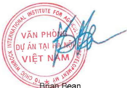
Brian Bean Chief of Party, USAID Reducing Pollution Activity